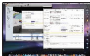
Finder的Quick Look功能,可以让你不开启应用程序就快速打开图片、视频和各种文档

“打开文件查看已成为历史”,这是苹果的口号。不打开怎么看呢?Leopard上的杀手级特性Quick Look就可以完成这一切。现在你只需要敲下空格键,即可浏览各种文件。图片、文本、PDF、电影、Keynote 演示文稿、Mail 附件、Microsoft Word 文档以及 Excel 表格统统都可以,借助第三方插件,你还可以浏览文件夹、压缩文档等,的确很方便。在笔者升级到Leopard后,直接开启文件的次数至少减少了一半,节省了大量时间。