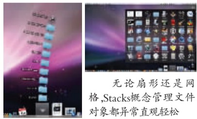
无论扇形还是网格,Stacks概念管理文件对象都异常直观轻松

文件管理,对于不少电脑用户来说颇为头疼。不过在苹果的世界里,文件管理却是一种轻松的享受。而Leopard的桌面中还引入了“Stacks”的概念,可以这样理解:它是一个对象(如文件夹)或者一组对象的“整合”,也是一种“显示”方式。用户可以把一个或一组对象都拖放到Dock上来创建“Stacks”,以便于快速访问。点击Dock中的Stacks图标后,文件与文件夹就会以网格或扇形方式展开,点击其中的图标就会打开相应的对象。Leopard提供了两个预设的Stack:一个用于下载文件,一个用于文档。当文件下载好之后,图标会弹跳两下提醒你,虽然是很小的细节,但是感觉很体贴也很有趣。