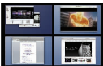
Space大大扩展了你的工作空间,不过界面的确一般

Space是Leopard另一项新特性,也就是所谓的内置多桌面环境。它和Windows的多任务切换有相同之处,也有不同之处。相同点是都用于多任务并行,不同的是Space可以把每个项目单独实现为一个“桌面”。当然,我们也可以把一个Space拖到另一个Space里。