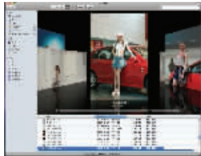
Cover Flow功能可以让你快速查到所需对象

文件查找时,打开Finder,你会觉得有一种似曾相识的感觉——不错,这就是iTunes的界面风格。侧边栏的项目被分类放置在目录中,如同iTunes中的来源列表一样。还有更Cool的,那就是连Cover Flow也加进Finder了。现在,在Finder下浏览文件不再是图标了,而是文件的内容排版显示。这下找文件快了吧!