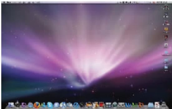
这就是Leopard的主界面图,搭配的是极光的主题桌面

拿到新系统的第一件事当然是安装啦,将光盘放入苹果电脑,重启,按住C不放,紧接着就进入安装画面了。