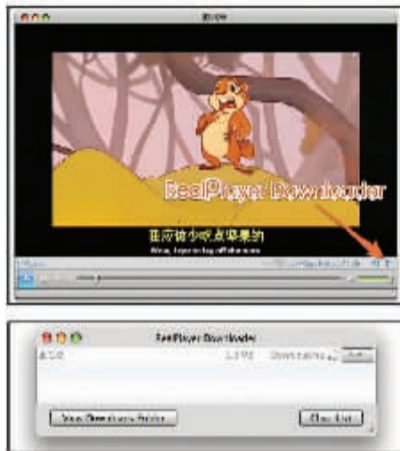
边看边保存对于下载网络视频相当有帮助

目前在网络上最为流行的视频格式就是RM、RMVB了,对于它们,RealPlayer是最好的播放软件。除了视频播放功能,最新版RealPlayer还加入了RealPlayer Downloader工具,只要打开它,就可将正在进行网络播放的视频自动下载,完成后点击SAVE即可保存在硬盘中。值得注意的是未保存之前千万不要把播放窗口关闭。有了它,土豆网、YouTube等网站上的视频就可以随心所欲地下载了。