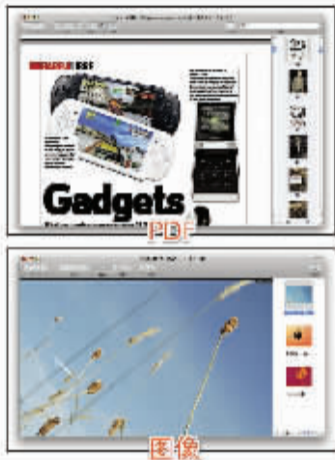
预览窗口上方就有缩放、幻灯片显示等功能按钮

打开PDF文档,同样可以实现缩放、移动、选择等功能,可以满足基本的使用需求:文本工具可以选取其中的文字进行复制;选择可以选择对象的一部分,进行复制保存。怎么样,OS X系统的预览功能强大吧。